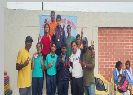
Division Level Swimming Competition at Greatman School Sagar