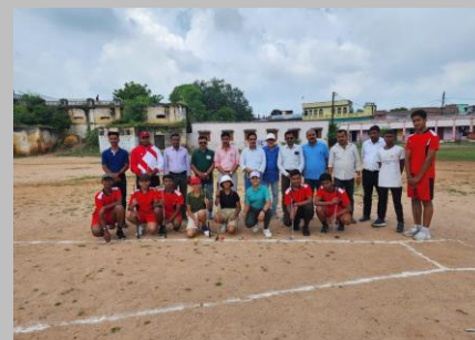
Division Level Golf Tournament at Tikamgarh