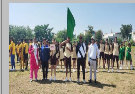
66 school State Games Handball Tournament at Shujalpur MP