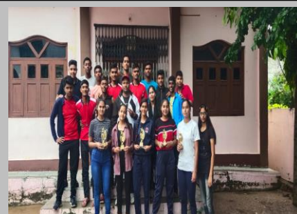
Division Level Handball Tournament under 19 boys and girls category at Tikamgarh