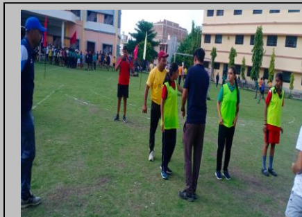
District Level Handball Tournament at Banda under 19 girl's category