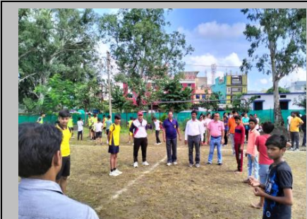
District Level Handball Tournament at Banda under 14 boy's category