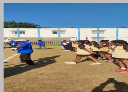
State Handball Tournament under 19 girls and boys at Shujalpur