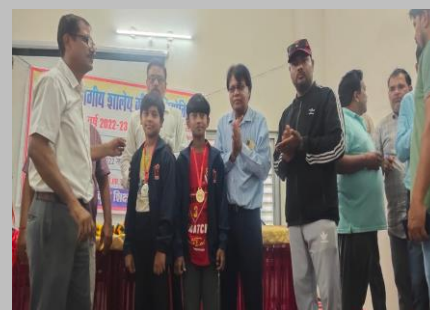
Division Level Skating Competition at Damoh