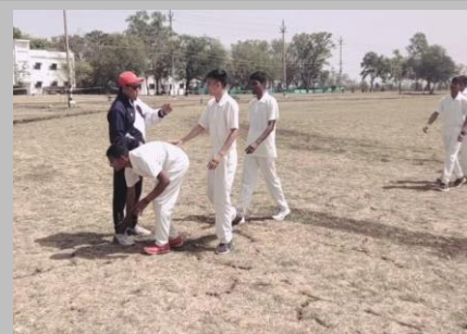
Inter School Cricket Match APS vs KVS conducted by Education Branch at Hawk